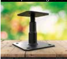
Pé de prumo regulável