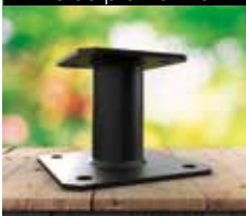
Pé de prumo fixo