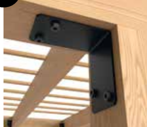
7 Esquadro para montagem 90°