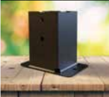
Pé prumo quadrado