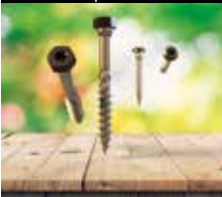
Parafusos para conexões