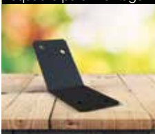
Esquadro para montagem