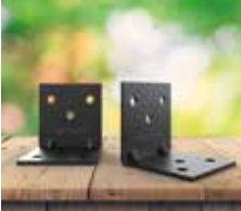
Esquadro para montagem