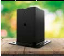
Pé prumo quadrado