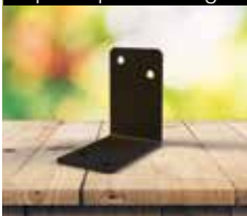
Esquadro para montagem