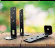
Pé de prumo regulável