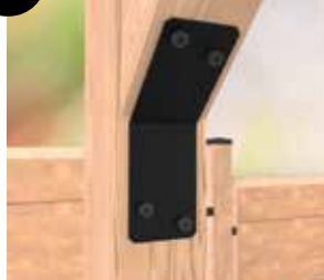
8 Esquadro para montagem 135°