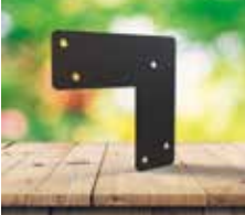
Esquadro em "L"