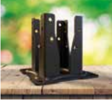
Pé prumo quadrado