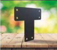
Esquadro plano em "T"